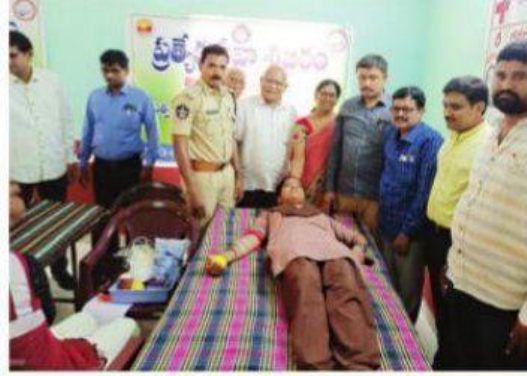
రక్తదానం చేస్తున్న యువతి