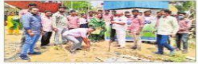
ఆర్బీజీ వద్ద ఇంకుడు గుంతలు తవ్వతున్న ఎన్ఎస్ఎస్ వలంటీర్లు